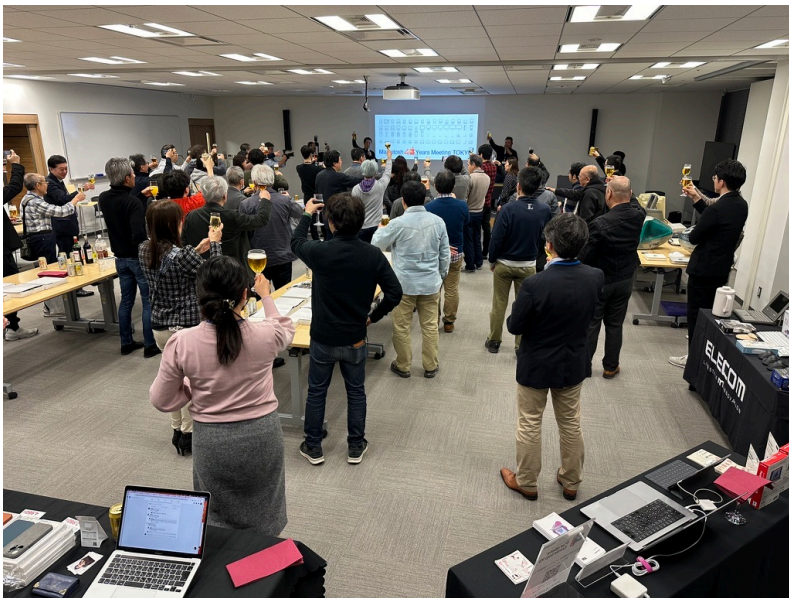
最初の乾杯 最後のじゃんけん大会も同様

Appleの歴史でしまゆぐ設立も入っていた 右端は米アップル副社長とアップルジャパン元社長の前刀氏