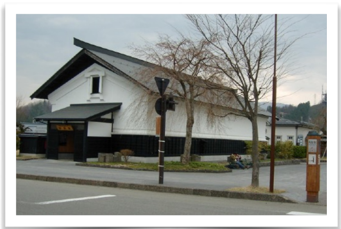
図7 角館のJR駅舎の色彩設計は当社が提案

(鉄黒)を混ぜた漆黒は吸い込まれる美しさ。漆喰やカキ殻の白は汚れなき晴れ晴れとする景色となる。欧米人にはわからないだろう。欧米の住宅は色柄の壁紙がいっぱいだし、絵本のような色彩の町並みがある。中国人も壁は白からクリーム色であるが、その上に写真や絵画を沢山飾るので折角のモノトーンの静寂が破られる。そんな部屋にいて落ち着くのか？写真は秋田の角館の武家屋敷風のJR駅舎。これはK社が色彩設計し塗料業界のグッドデザイン賞を受賞した。