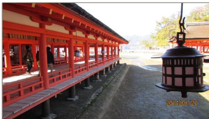
図2 2014.1月 増田が訪問した巖島神社

その時に思ったのは、この朱色の顔料は何？天然？、人工？、接着剤は膠？それとも合成樹脂の塗料？ さて天然の顔料と仮定すると、鳥居や神社の魔除けの朱色は酸化鉛の鉛丹(えんたん、四酸化三鉛 ( Pb_3O_4 ))である。重金属の鉛？まだ鉛化合物を一般市民が触るところに使っているのか？ それは無いだろう。それとも自動車の赤ソリッド色と同じ合成顔料なのか？子供の頃、釣りの鉛のオモリを歯で潰したり、鉛管の水道水を飲んでいて記憶が通り過ぎた。酸化鉛( PbO )の被覆に覆われているから鉛イオンが体内に入ることはない。