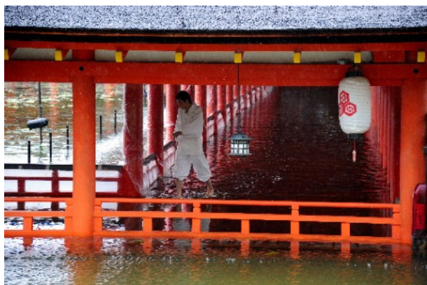
図1 2012.9月の台風16号で水没した神社

2014年1月に初めて安芸の宮島に行った。海の中に建つ巖島神社と大鳥居が観光写真として有名である。その2年前の2012年9月、台風16号によって水没した神社の映像をTVで見っていた。波が回廊を洗い、本当に海の中に浮かんでいる風景だった。広島市内の河口からフェリーに乗り50分あまりで着く。台風後の修復も終わり塗りたてのきれいな朱色の神社と鳥居をバックに記念写真した。