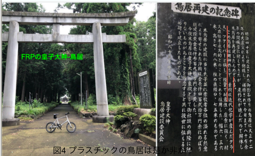
図4 プラスチックの鳥居は是非が

これは藤沢市の郊外にある皇子大神の鳥居です。明治40年に御影石で作られたが、関東大震災で被災し、再建し80年維持した。老朽化のため昭和63年に耐久性を考慮し、FRP（繊維強化プラスチック）にした。合成高分子も神道の信仰を邪魔するものではありません。造花を見て和むのも同じ。要するに、 無形の信仰心が本質です。