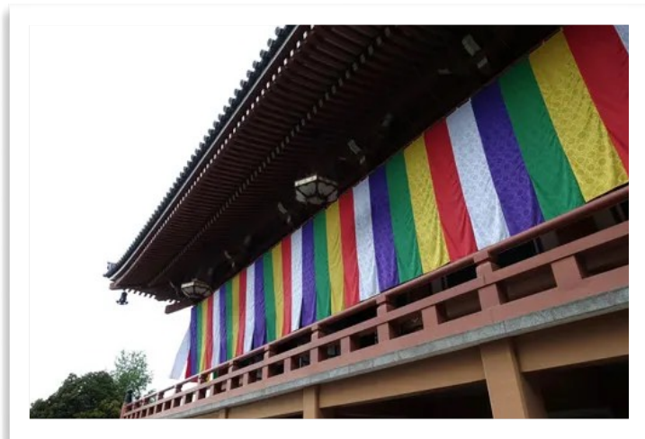
図9 仏教の五色幕の色の意味は？