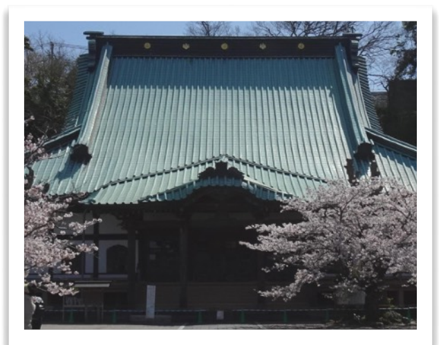
図8 鎌倉光明寺の緑青の本堂と桜

緑青(ろくしょう)も落ち着く緑である。銅像、銅葺き屋根が緑青に覆われていると、伝統美を感じる。これは絶対に復元修復したら駄目です。建立当時のピカピカ金属光沢になったら古代の歴史ロマンスが興奮めです。想像してみてください、自由の女神がピカピカ光るC3-PO(スターウォーズの金色の人形ロボット)のようになった姿を。緑青は銅塩(O 2 , CO 2 , H 2 O, NaClと反応したもの)で、毒はない。