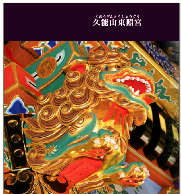
図6 復元修復の久能山東照宮