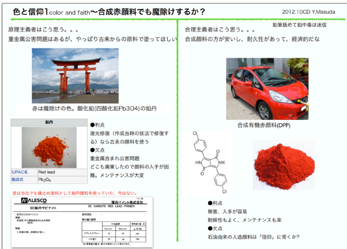
図3 魔除けの赤は酸化鉛か？合成顔料か？

一方、身の回りの赤色はほとんどが石油化学系の合成顔料である。下図では、最後の有機顔料と言われるDPP（ジケトピロロピロール）の骨格を示している。この顔料は鮮明度が高く、且つ他の合成赤顔料に比べて隠蔽力もあり、化学薬品にも侵されず、太陽の下でも退色しにくいし、価格も、～他の顔料に比べて高いが～、工業製品に使えるレベル（1kg、数万円）。鮮明な赤色の車は100%この顔料を使っている。この顔料は耐候性があるので10年に1度の塗替えで良い。一方、鉛丹と膠の塗料は耐久性が無いので5年に1度は塗り替えたい。